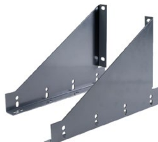
Lumiaidan kiinnike O / V*